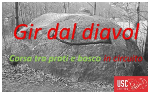
Il Sasso del Diavolo

(in palio le iscrizioni per la 40ima Tesserete-Gola di Lago del 25 aprile 2020)